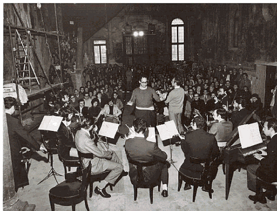
IL PRIMO "CONCERTO DELLA DOMENICA"

bachiana come terreno di dialogo tra razionalità e invenzione.